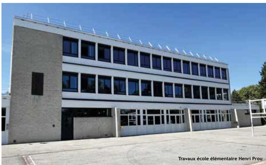
Travaux école élémentaire Henri Prou

Dans la continuité des actions éducatives mises en place par la Ville, ce dispositif permet de renforcer la qualité des activités proposées sur les temps périscolaires. Ces activités sont pensées en complémentarité avec les apprentissages scolaires pour améliorer le développement de l'enfant. Ce dispositif a également été construit pour favoriser l'accès à la culture et au sport pour tous et ainsi réduire les fractures sociales.