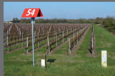
Différents types de bornes repérant les canalisations de transport