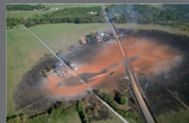
Conséquences d'une fuite sur une canalisation de transport, Appomattox (USA), 14 septembre 2008.